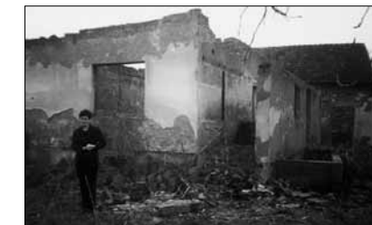
• Дом Гойко

вместе одной семьей уже не было страшно.