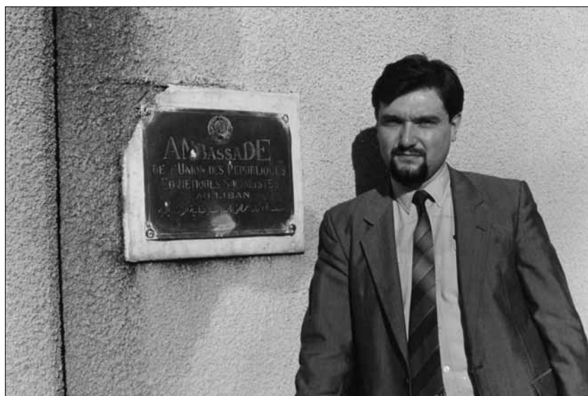
• Алексей Новотчинов, автор рецензии

о бытовавшем в то время в маронитских кругах мнении о возможности урегулирования затяжного гражданского конфликта в Ливане посредством советского вооруженного вмешательства.