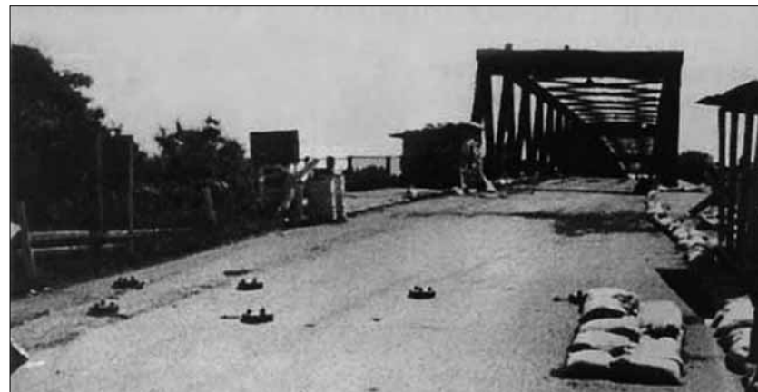
• Мост через реку Саву в 3-х километрах от Нови Варош. По этому мосту сербы бежали от хорватов в Республику Сербскую. Мост был уничтожен хорватской авиацией