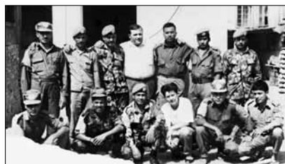
• Непальские миротворцы, которые должны были охранять сербскую колонну

Через некоторое время после начала расстрела колонны прилетели хорватские самолеты. Они летали на бомбежку к Босанской Градишке и либо самолично (что скорее всего) решили вмешаться, либо получили приказ добить колонну. На растерзанную колонну обрушился огонь с неба, а из-за леса заработала хорватская артиллерия. Снаряды выкашивали оставшихся в живых. Не повезло и хорватам,