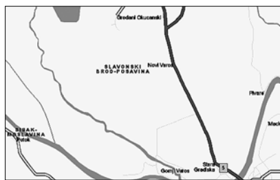
• Нови Варош

По пути к реке Саве на легковой машине с мамой и еще двумя родст-