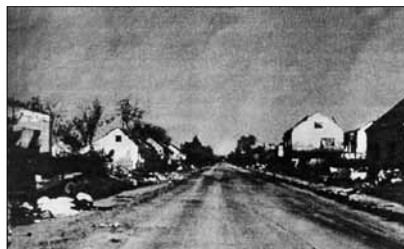
• Нови Варош, где и произошло истребление колонны